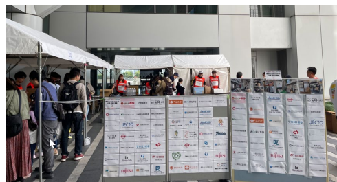
寄付品を提供していただいた企業・団体名（ロゴまたは名称）をブース内に掲示します